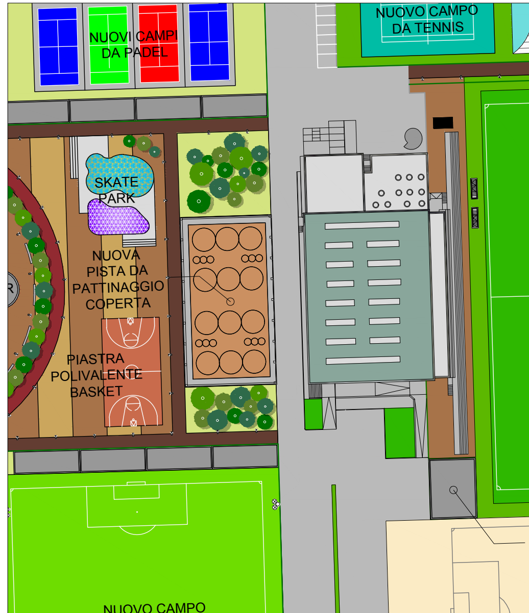
Inquadramento generale - scala 1:2000

Per le piste coperte l'altezza libera, lungo il perimetro dello spazio di gara delimitato dalle balaustre o dalle segnature, deve essere non inferiore a m. 4,00 e l'altezza media non deve essere inferiore a m 5,00. La pista da gioco ha una forma rettangolare con gli angoli di 90°, sono omologabili anche piste con angoli raccordati con archi di cerchio i cui raggi di curvatura non devono superare i massimi sotto indicati.