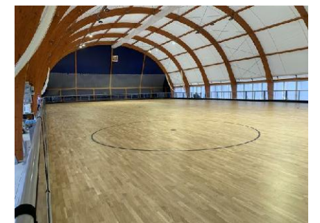
Esempi di piste da pattinaggio coperte