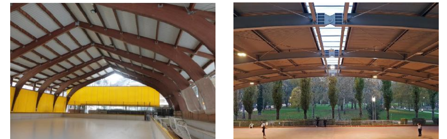
Esempi di piste da pattinaggio semi-coperte